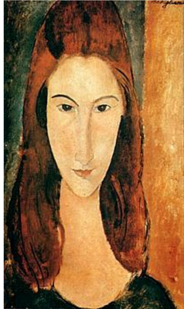
Модильяни. Портреты Жанны Эбютернь. 1918